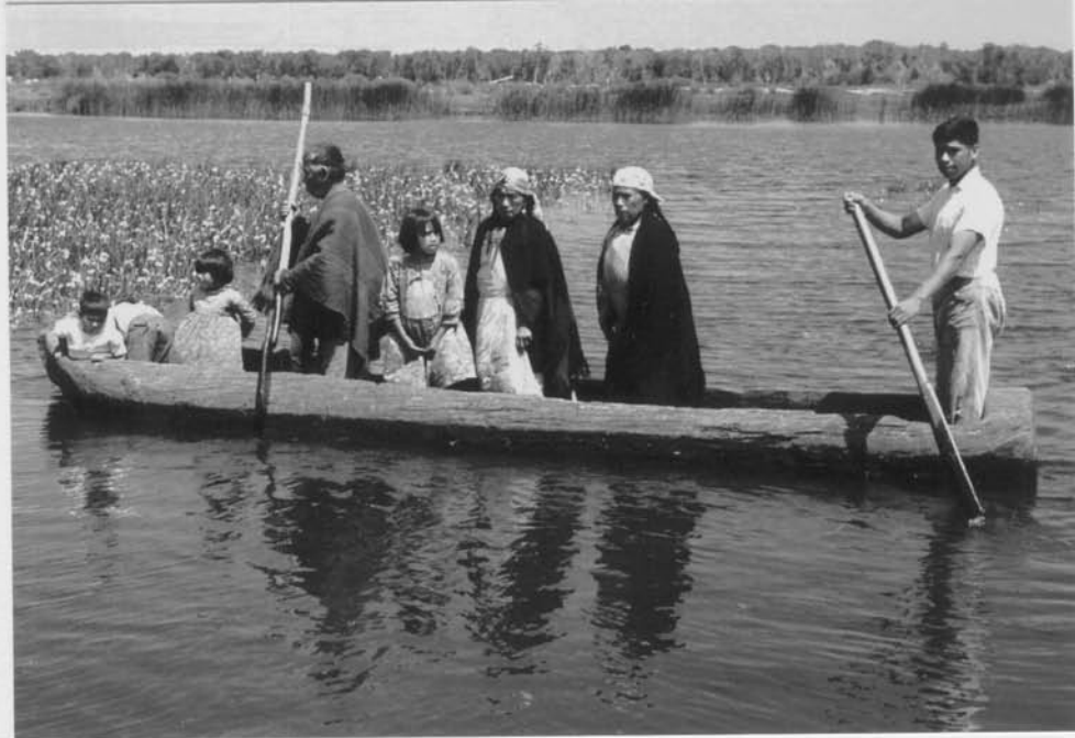
Una gran familia mapuche cruzando el Lago Budi en una canoa. Luego de atravesarlo sigue el viaje en una carreta de bueyes de dos ruedas. Ruedas de disco completo.