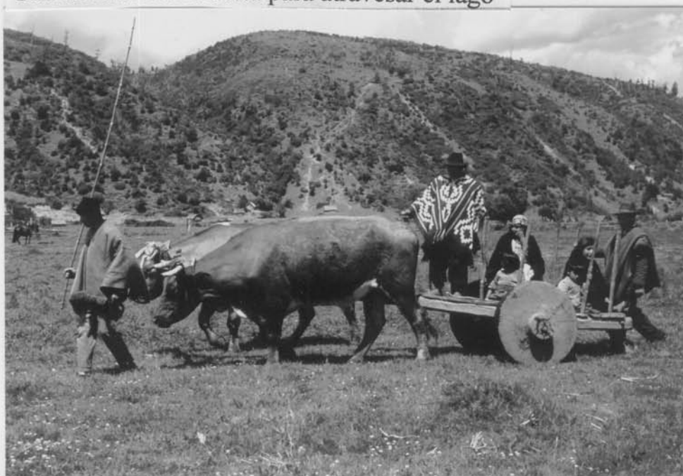
Carreteras de ruedas de disco entero continúa el viaje