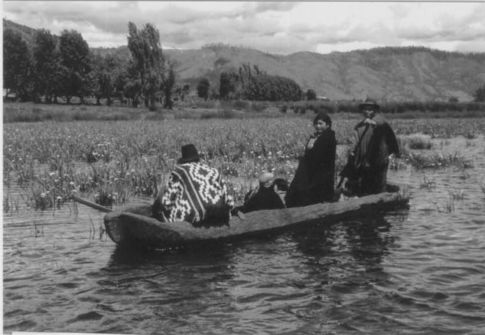
Una canoa bien robusta para atravesar el lago