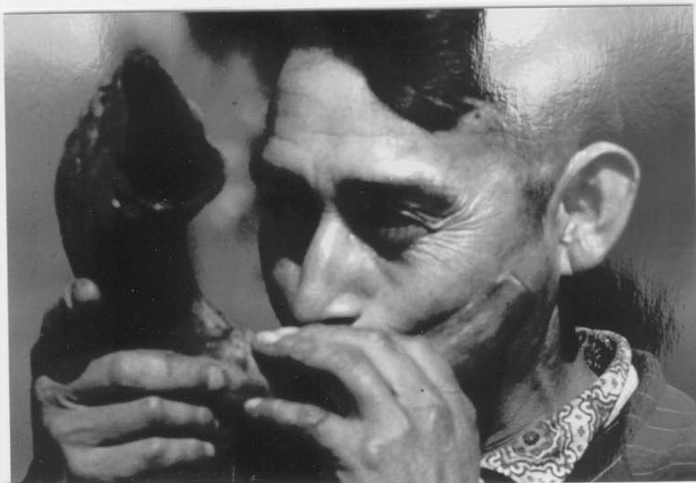
KÜLLKÜLL Pito,hecho de cuerno.. Sonido estridente. Se utiliza para llamados o para reforzar ritmos de danzas.