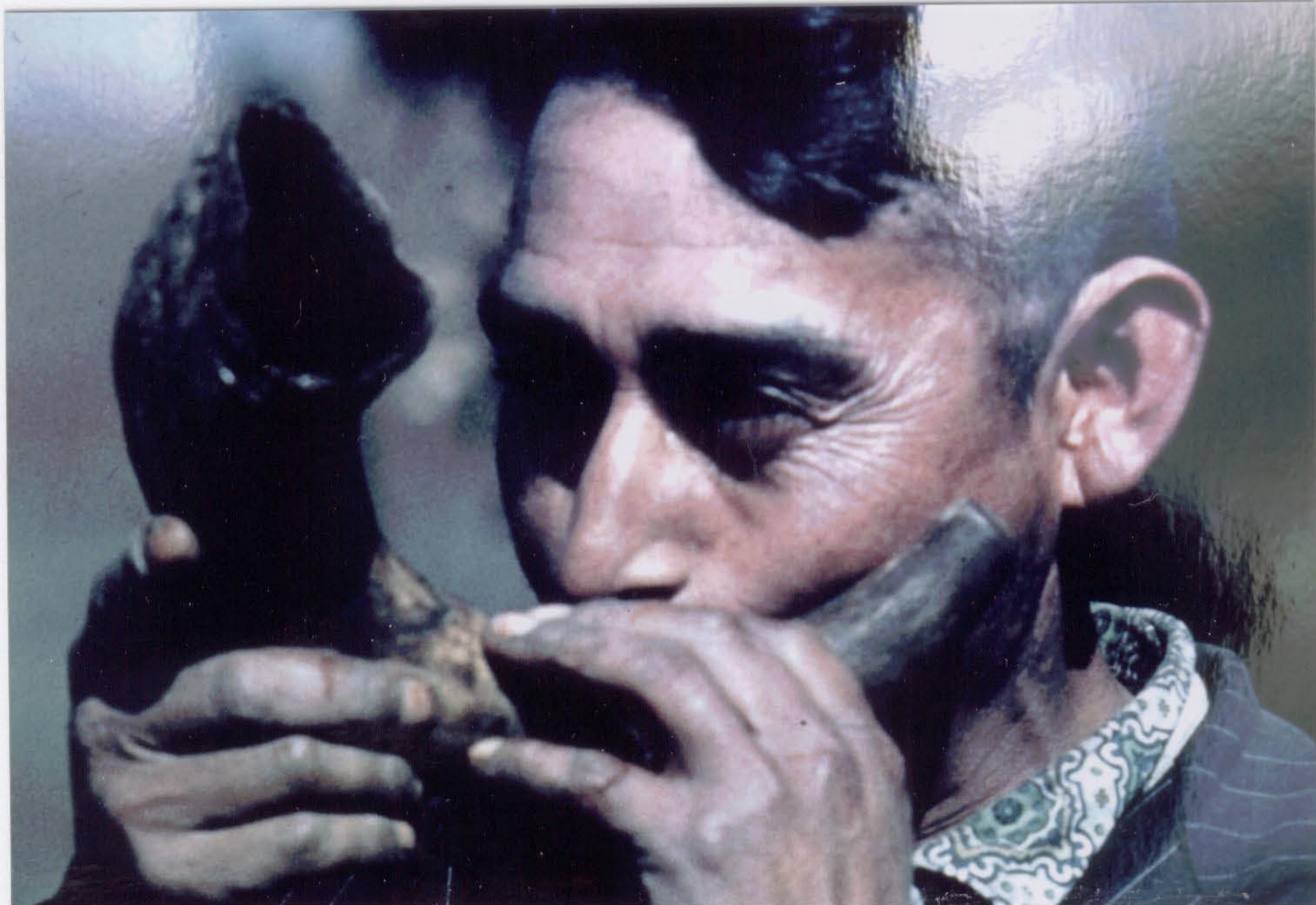
Das KUHORN oder CÜLLCÜLL benutzt man für Rufsignale. Beim Tanz gibt es den Rhythmus an.