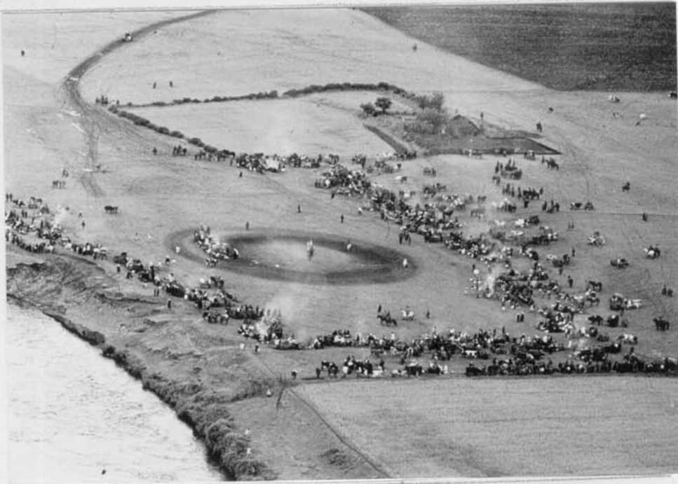
Ñgillatún al lado del río Quepe desde una avioneta.

La próxima mañana es demasiado para mí. Me consigo una avioneta para volar bajo varias veces sobre el Ñgillatún.