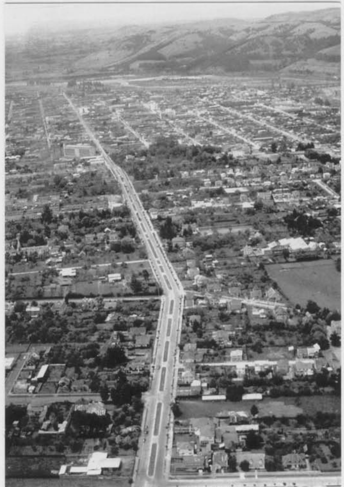
La Avenida Alemania de 1963

Ubicación y nombres de los colonos alemanes, los cuáles fueron ubicados por el Gobierno entre 1885-1887 en los alrededores de Temuco.