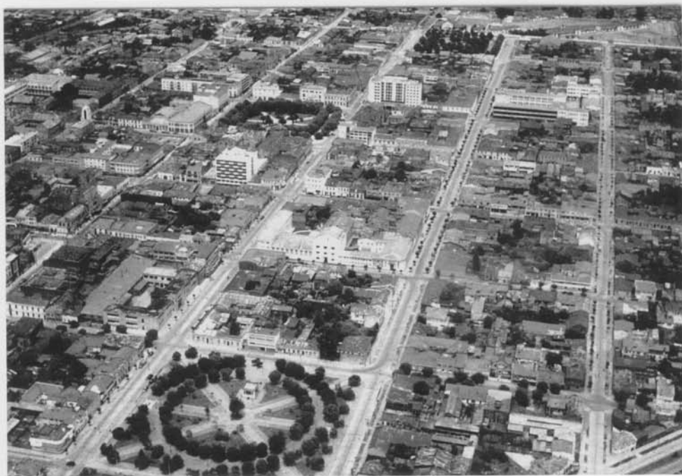
TEMUCO en el año 1.963 – con 110.000 habitantes

Ubicación y nombres de los colonos alemanes, los cuáles fueron ubicados por el Gobierno entre 1885-1887 en los alrededores de Temuco.